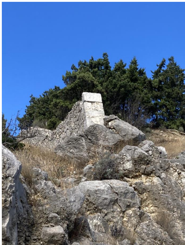
Каменная ограда имения, южное окончание