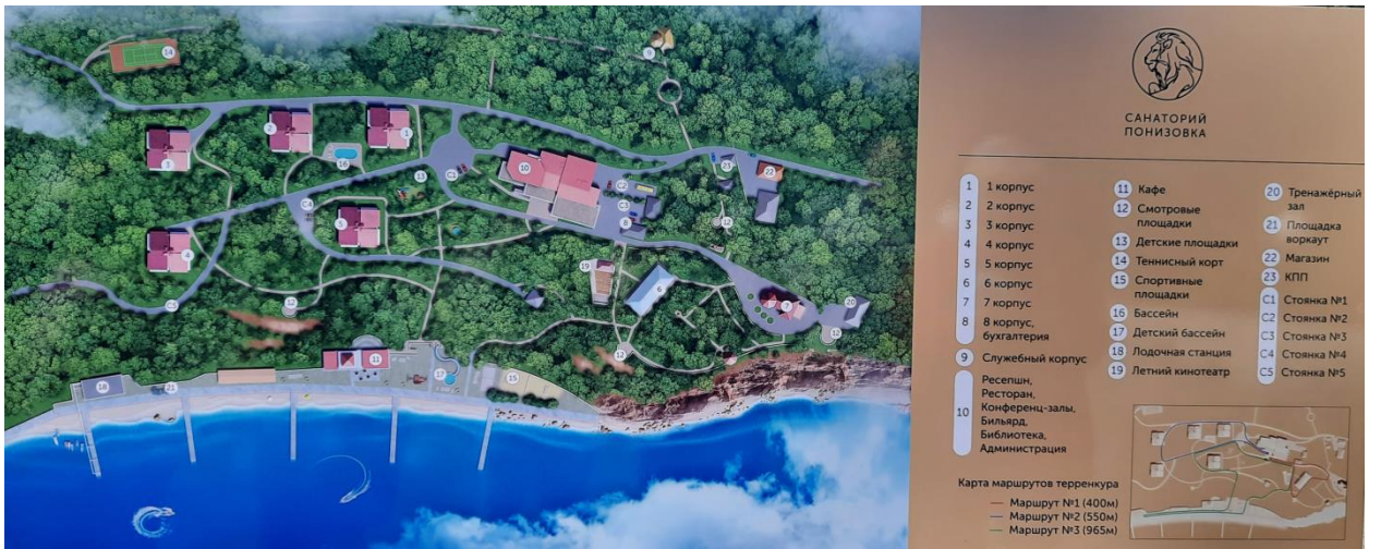
План территории санатория «Понизовка»