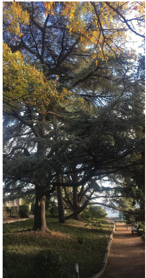
Линейная группа голубых атласских кедров