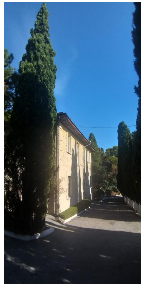
Кипарисы у флигеля