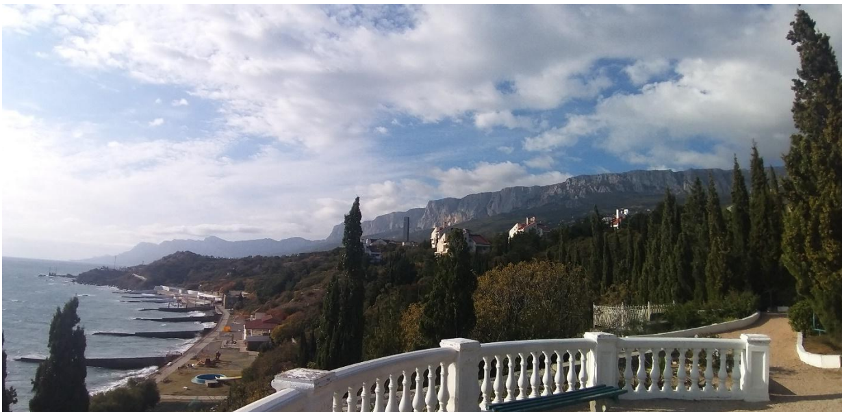
Широка панорама с западного круглого балкона

Таким образом, Дача Г.Ф. Понизовкиных, возникшая в начале XX в. и объединяющая в своем составе исторические сохранившиеся части: усадебный дом, служебные постройки, флигель, парк и парковые сооружения в своей ландшафтной целостности , обладает всеми признаками объекта культурного наследия, поскольку в соответствии со ст. 3 Федерального закона N 73-ФЗ (ред. от 11.06.2021) "Об объектах культурного наследия (памятниках истории и культуры) народов Российской Федерации" представляет собой объект недвижимого имущества ... с исторически связанными с ними территориями ... и иными предметами материальной культуры, возникший в результате исторических событий, представляющий ценность с точки зрения истории, архитектуры, искусства, эстетики, социальной культуры и являющийся свидетельством эпох и цивилизаций.