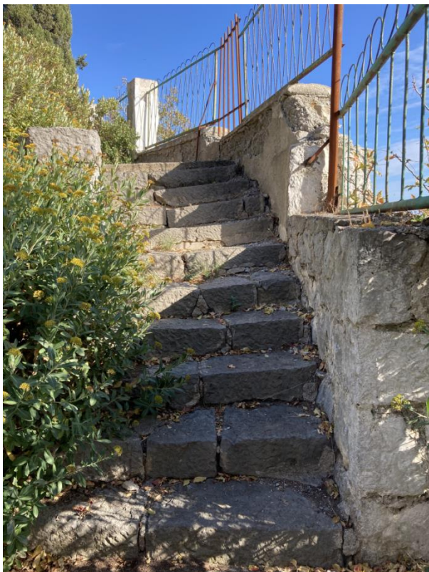
Лестница к морю