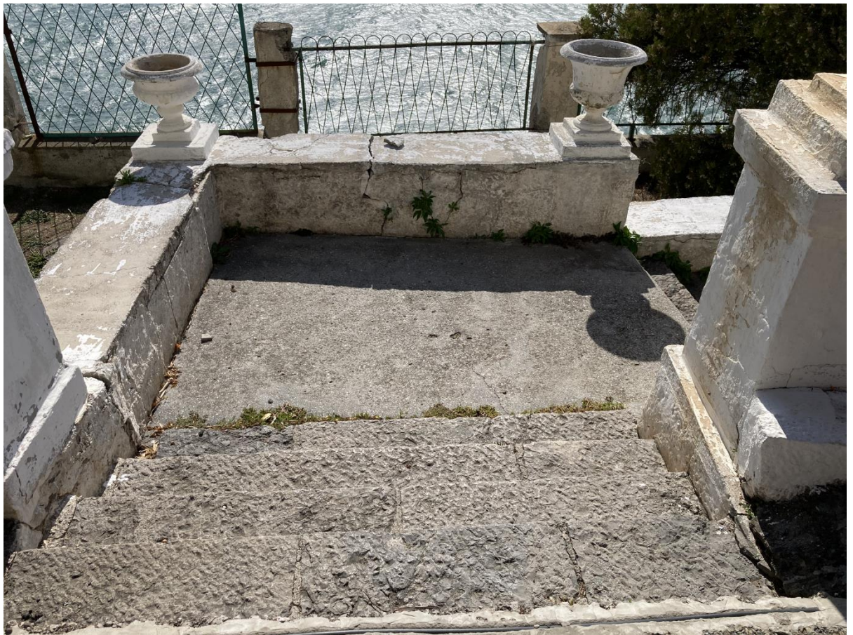
Терраса с балюстрадой и лестницей к морю