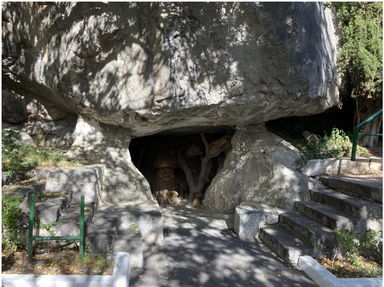
Грот с лестницами