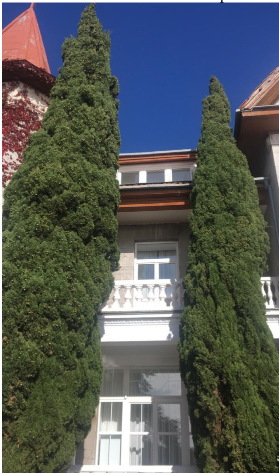
Кипарисы перед западным фасадом дачи