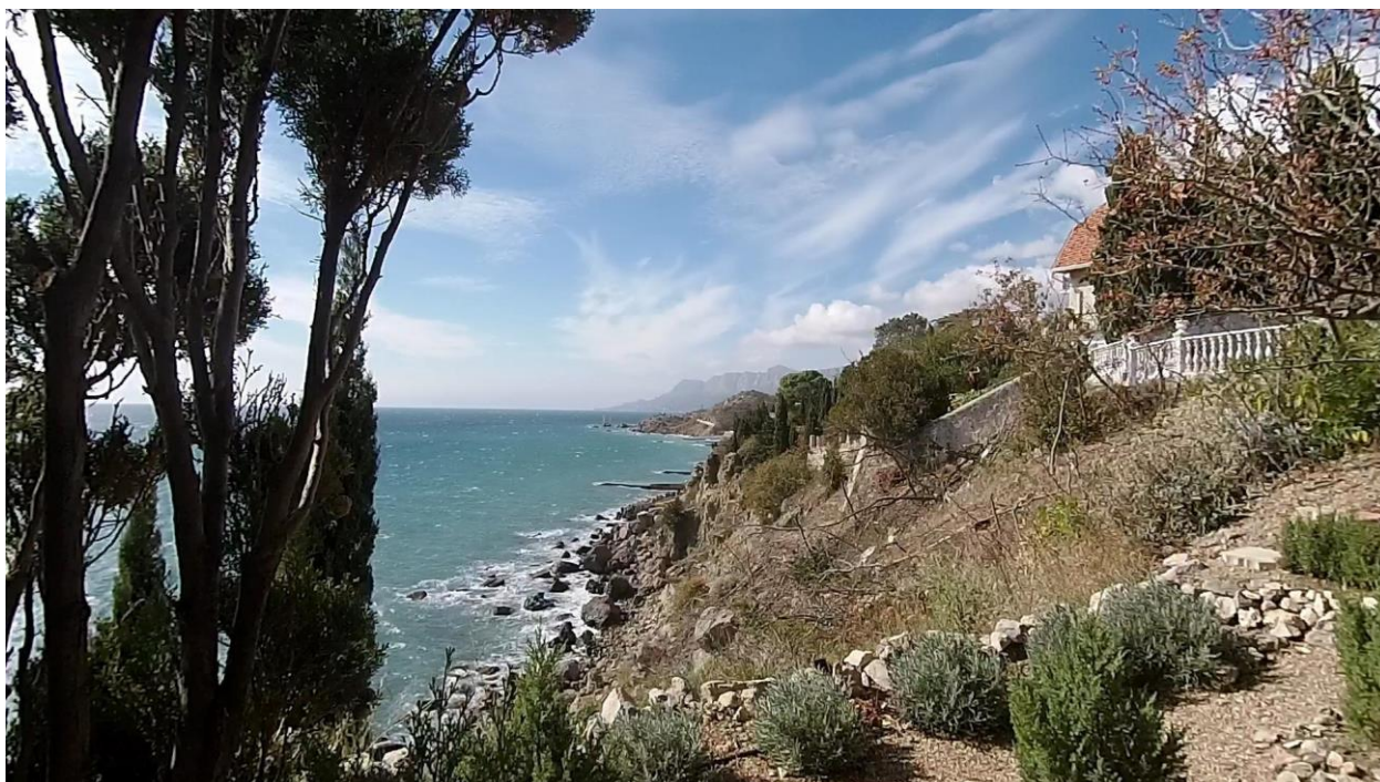
Видовое раскрытие на бухту, мыс Святой Троицы