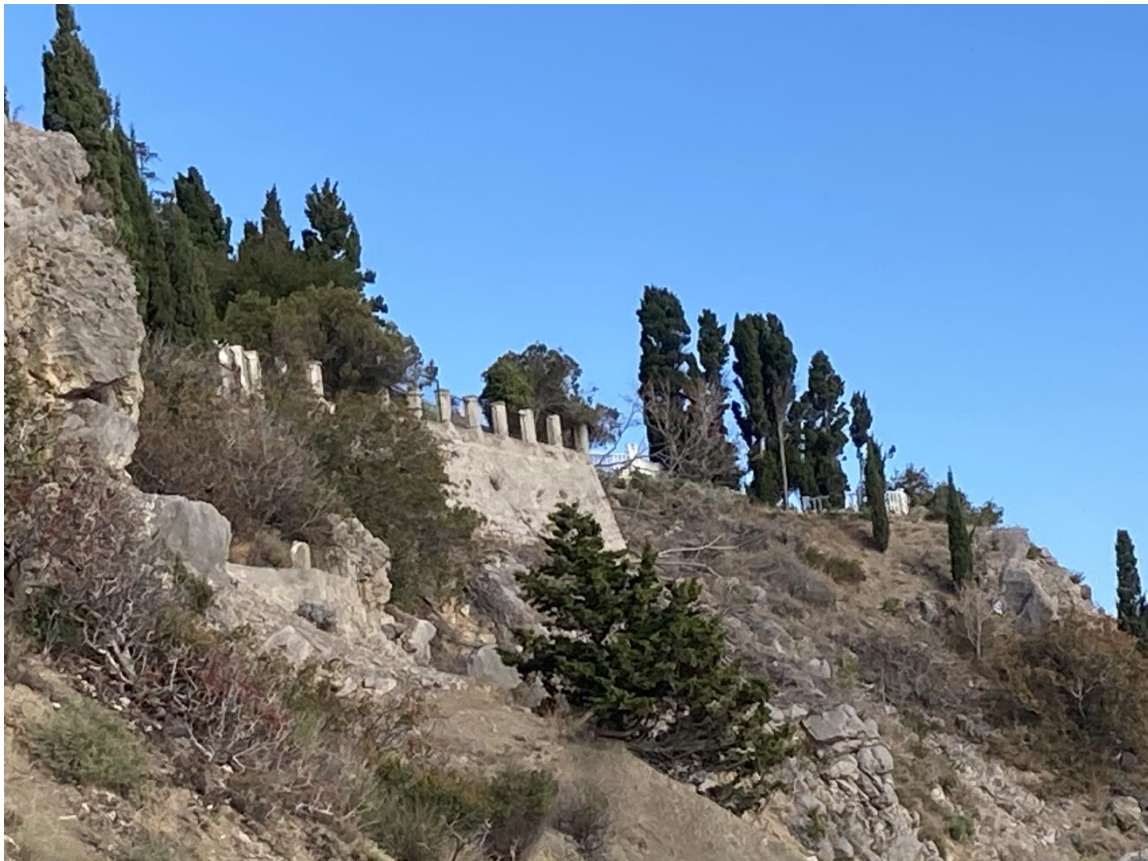
Каменная обзорная площадка со столбами