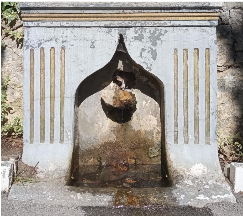
Пристенный питьевой фонтан в татарском стиле