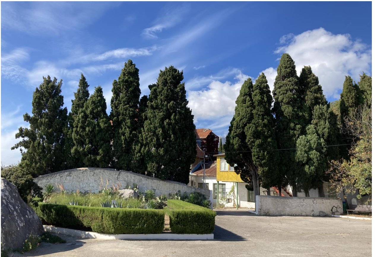
Каменная ограда с воротами