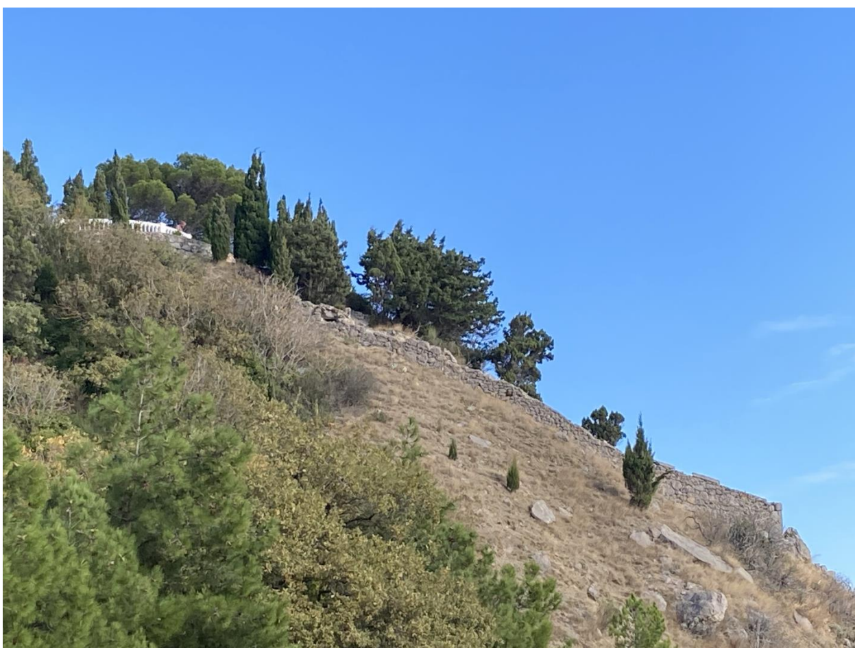
Каменная ограда имения