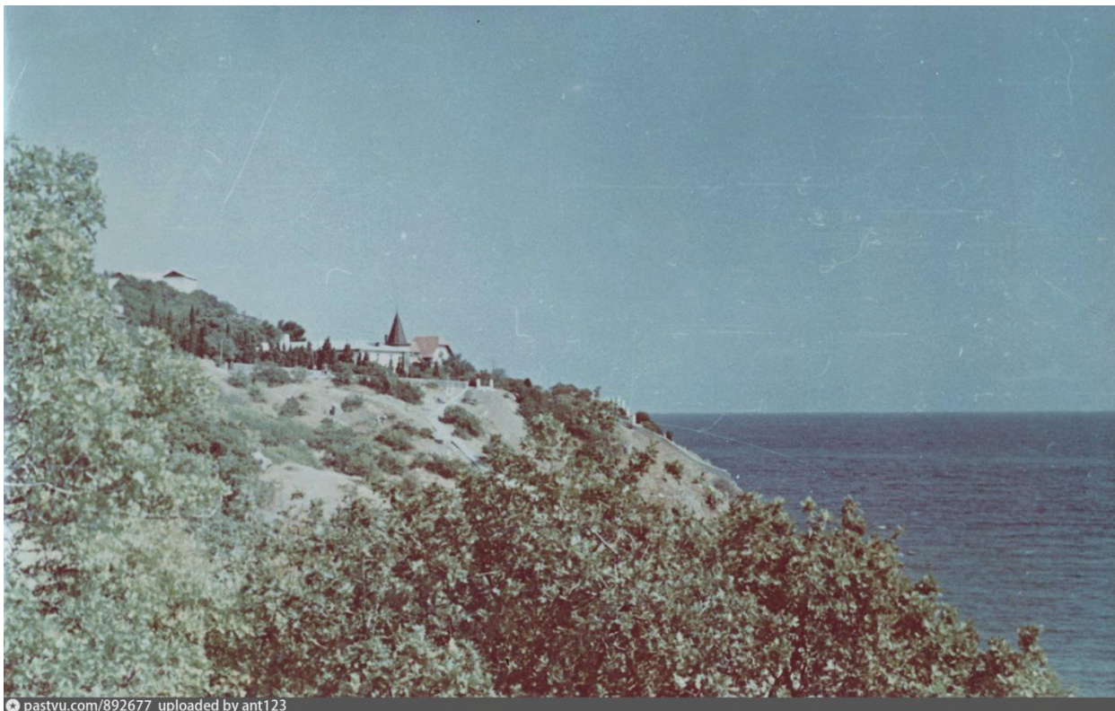
Фото 1961 г.

Первоначальная архитектурно-планировочная и композиционная структура участка имени Понизовкиных практически не изменилась со времени создания, за исключением строительства 6-го корпуса санатория в пределах участка дачи Понизовкиных. Последняя изобилует старовозрастными деревьями, элементами благоустройства и малыми архитектурными формами (грот, фонтан в татарском стиле, фонтан-бассейн и др.).