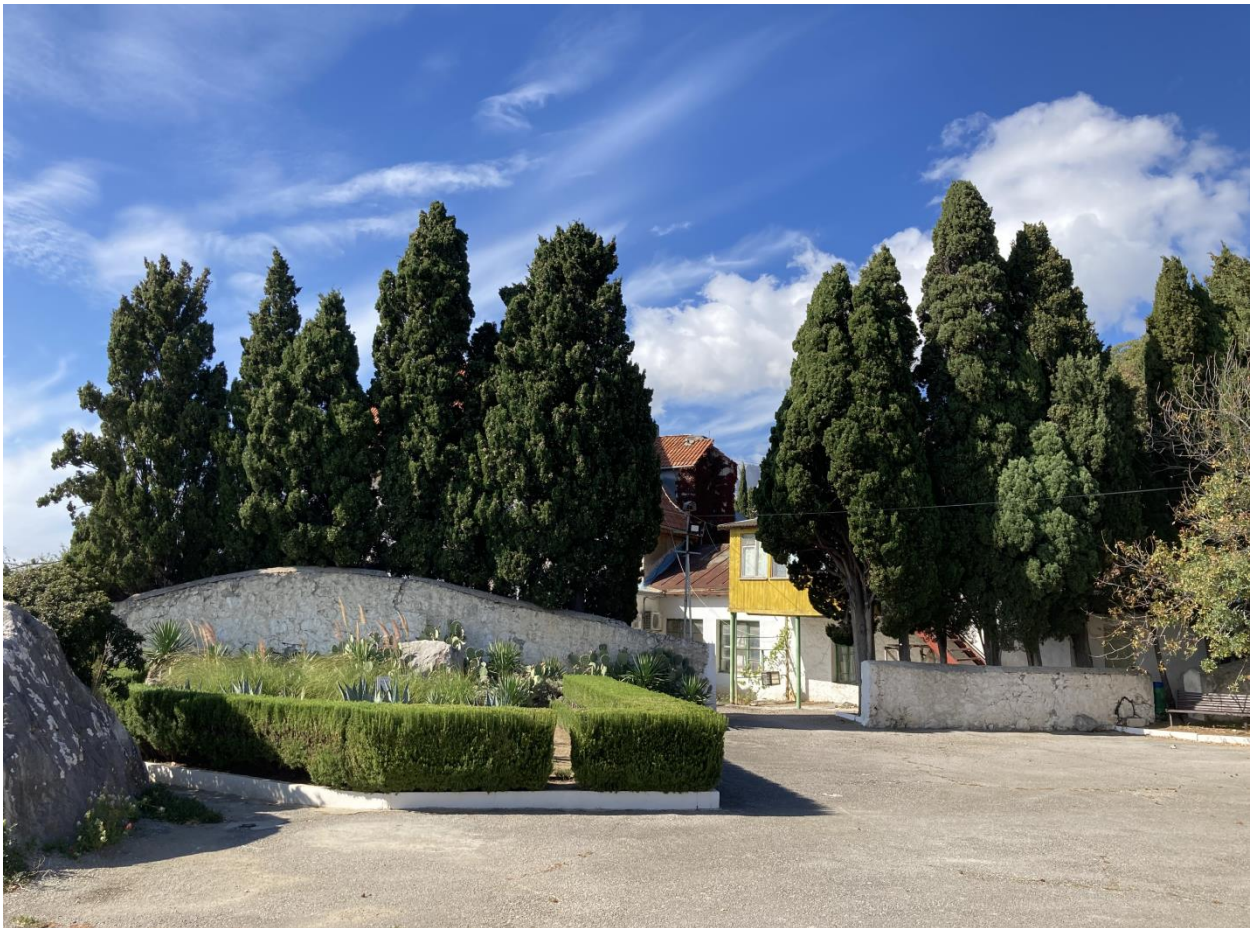
Живая стена из кипарисов на заднем дворе дачи Понизовкиных