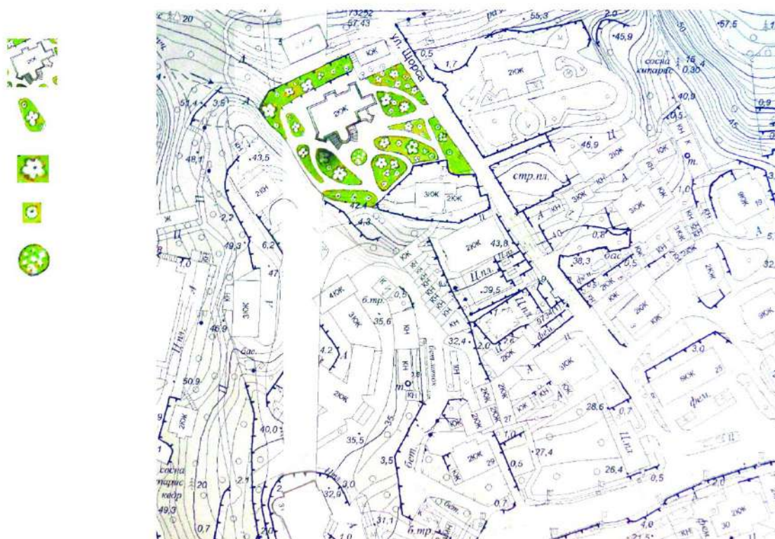
Усадьба Масловой – Оболенских, рабочий макет

Объект «Дом и флигель на 1905 г. – Масловой, на 1912 г. – князей Оболенских» числится под №158 в Перечне выявленных объектов культурного наследия, расположенных на территории Республики Крым (Приложение №2 к Постановлению Совета Министров Республики Крым от 20.12.2016 № 627). Парк усадьбы как ОКН не выявлен.