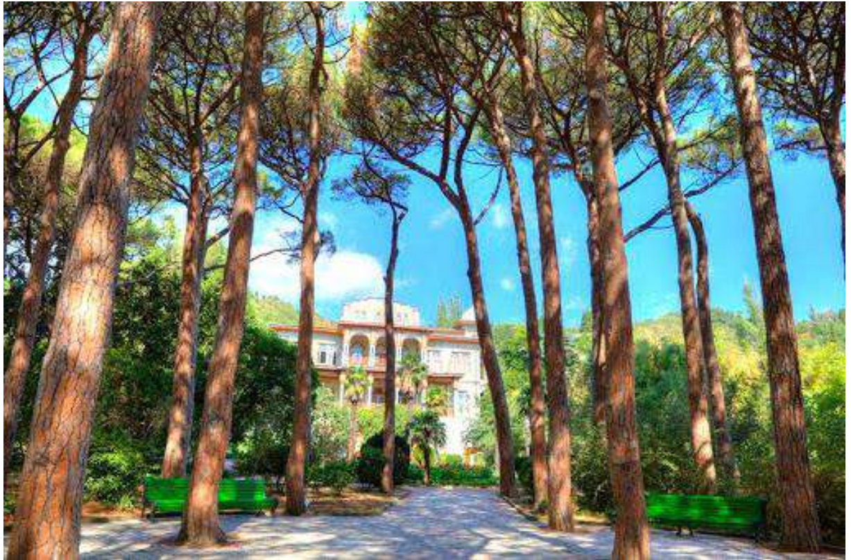
Роща сосны итальянской (пинии) в парке Утёс-Карасан. На дальнем плане дворец Раевских.