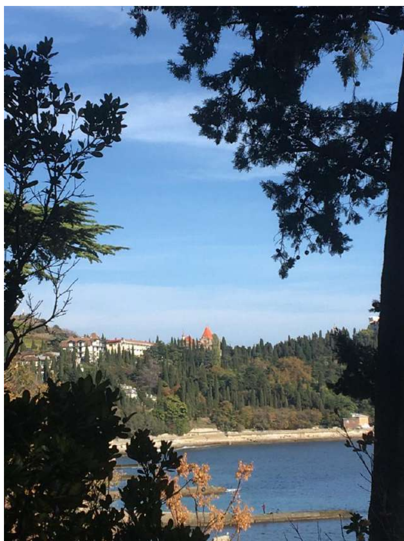
Карасан – вид на м. Плака