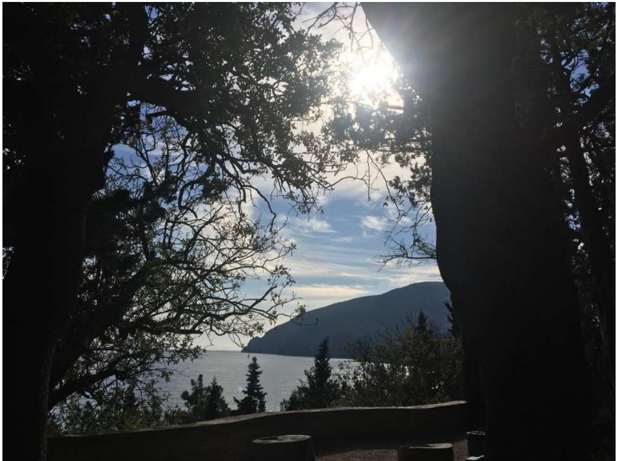
Карасан. Вид на Аю-Даг