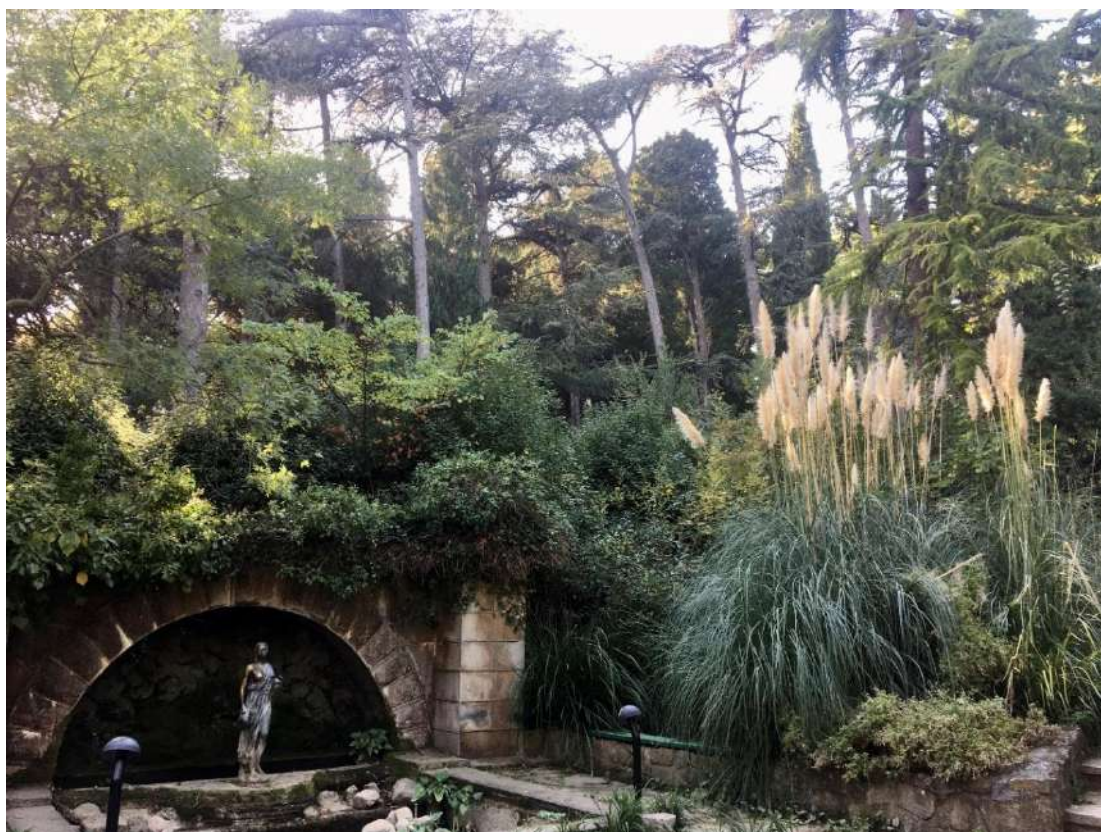
Ландшафтная композиция с фонтаном «Гречанка»